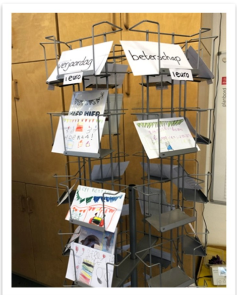
Het kaartenrekje van groep 3